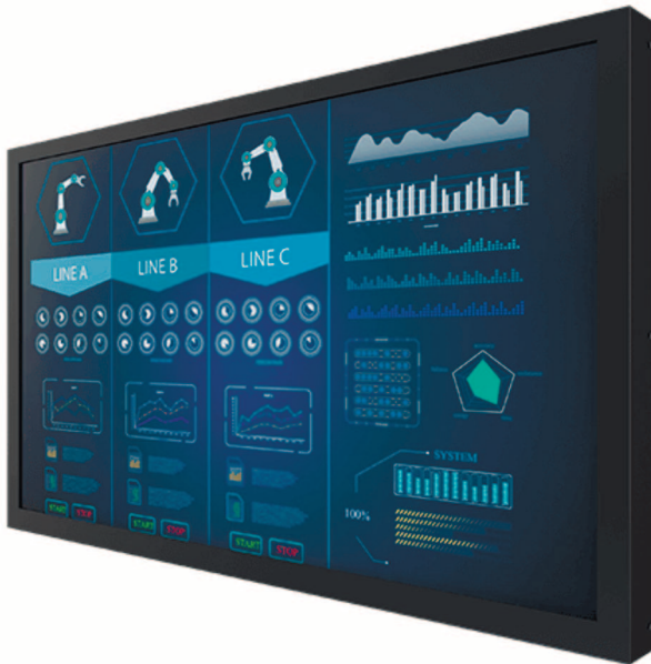
Рис. 2. Зовнішній вигляд сенсорного дисплея W24L100-CHC10D 24"