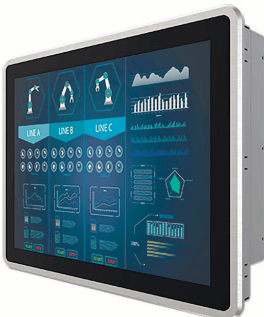
Рис. 3. Зовнішній вигляд сенсорного дисплея R15L600-PPC3OD 15"

У серії зовнішніх дисплеїв на шасі з емнісними