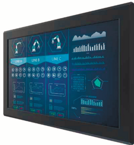
Рис. 1. Зовнішній вигляд W24L100-PMC1OD